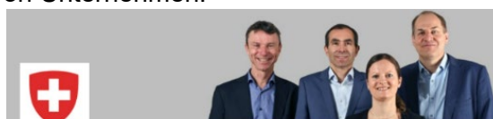
Nationaler Kontaktpunkt OECD-Leitsätze Fördert die Umsetzung der OECD-Leitsätze für multinationale Unternehmen und die verantwortungsvolle Unternehmensführung Öffentlicher Dienst · Best: 595 Follower

Seit Februar 2020 ist der NKP in den sozialen Medien auf LinkedIn präsent und gewann bis Ende des Jahres bereits über 500 Follower.