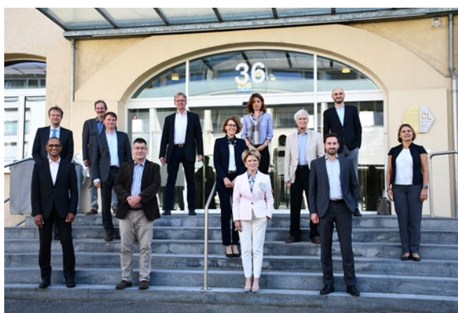
NKP-Beirat am 15.9.2020 mit vier neuen Mitgliedern (vgl. Mitgliederliste im Anhang)

Der Beirat hat in der Berichtsperiode 2020 zweimal getagt (3. September, 15. Dezember). Die Öffentlichkeit wurde jeweils mit einer kurzen, auf der Webseite des NKP publizierten Mitteilung über den Inhalt und die Ergebnisse der Beratungen informiert. 2