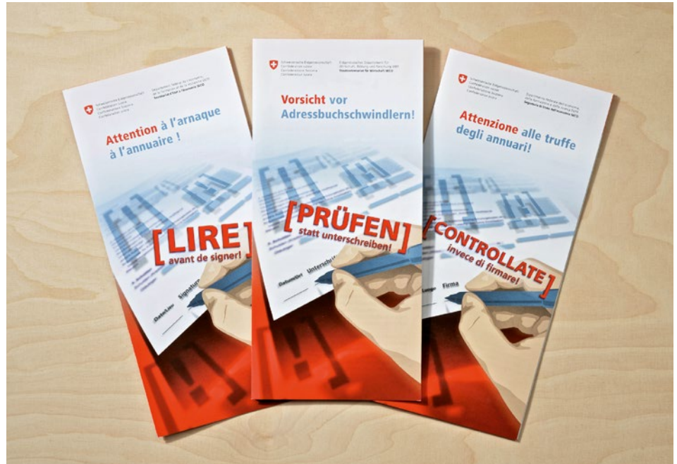
Der Flyer «Vorsicht vor Adressbuchswindlern!» liegt in einer überarbeiteten Version vor und berücksichtigt neue unlautere Geschäftsmethoden.

An vorderster Stelle der beim Seco eingegangenen Beschwerden gegen unlautere Geschäftspraktiken stehen nach wie vor die unerbetenen Werbeanrufe. Stark abgenommen haben hingegen die Beschwerden gegen die Werbefahrten – dank der Erfolge vor Gericht. Medienmitteilungen und eine Sensibilisierungskampagne haben zudem vor unlauteren Geschäftspraktiken gewarnt.