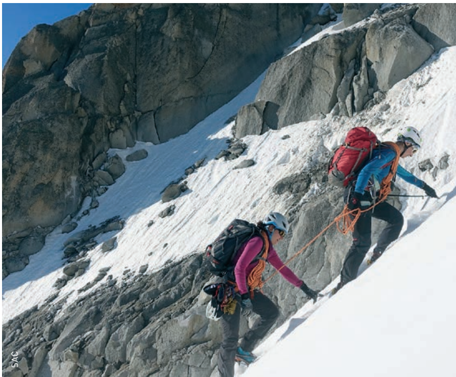
Ob Klettertour oder Skitour: mit «Suisse Alpine 2020» wird die Planung einfacher denn je.

Eine Auswahl von Routenbeschreibungen wird kostenlos angeboten. Dabei handelt es sich um gängige, eher