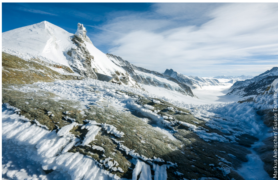
La préservation de paysages naturels, comme ici sur la Jungfrau, est importante pour l'attractivité du pays comme destination de vacances.

dans le tourisme suisse et déterminer les objectifs et les mesures à définir en matière de durabilité à partir de 2022 dans la politique touristique suisse. Pour réaliser ces travaux, le SECO a mandaté