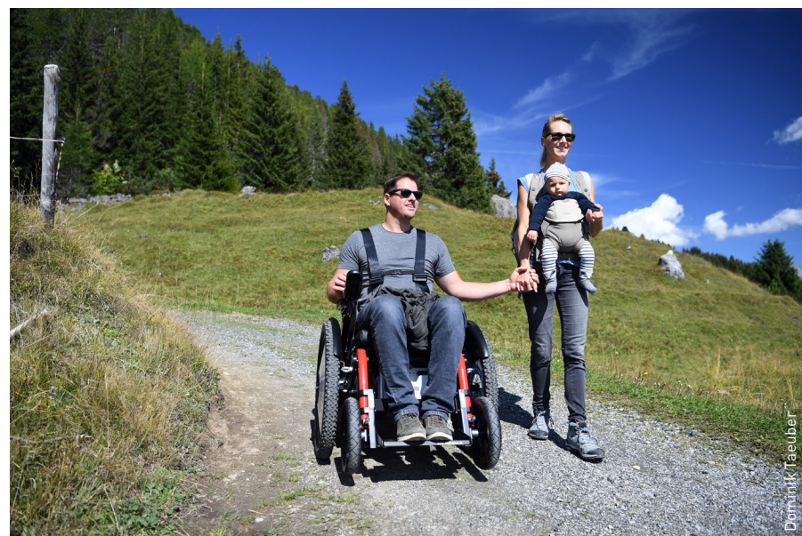
Les fauteuils roulants tout-terrain Mountain Drive ont été loués plus de 120 fois pendant la saison estivale 2019.

Le Mountain Drive répond à un important besoin pour les familles concernées. Pour elles, le fauteuil roulant tout-terrain ouvre de toutes nouvelles possibilités d'activités de loisirs. C'est la raison pour laquelle la Fondation Cerebral souhaite créer un réseau national de location dans les années à venir. Grâce au soutien d'Innotour, 20 destinations et offres différentes pourront être équipées dans un avenir proche. Ainsi, un plus grand nombre de personnes à mobilité réduite auront l'opportunité de vivre des expériences sans limites dans les montagnes.