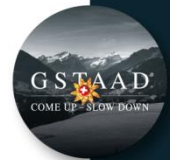
Filiale UBS de Gstaad