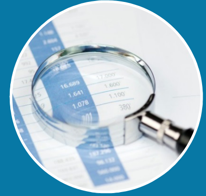
Abschlussprüfer- aufsichtsstelle (APAS)

Bundesamt für Wirtschaft und Ausfuhrkontrolle