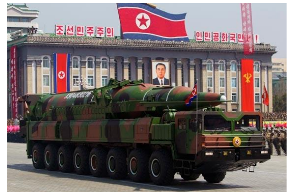
Interkontinentalrakete Typ KN-08, PRK