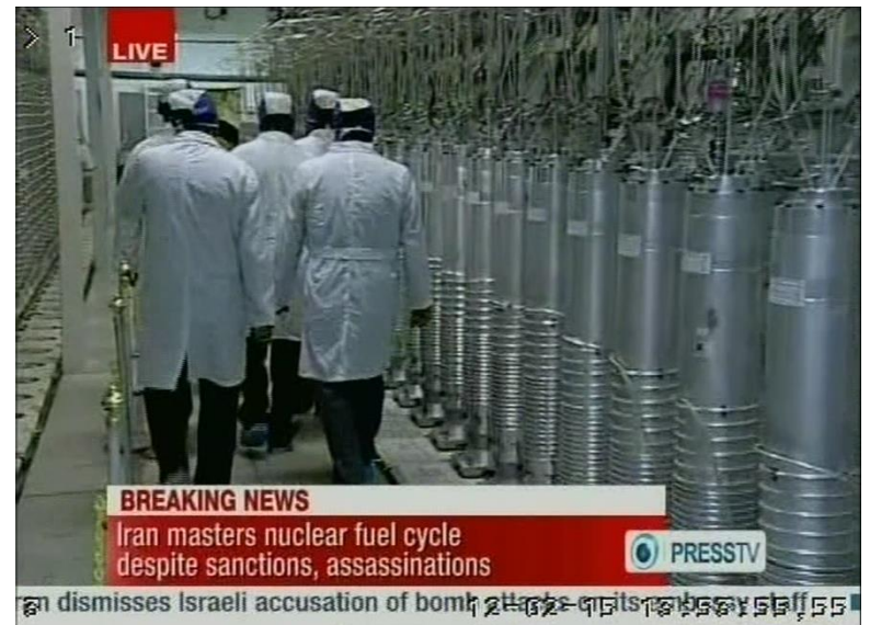
Pilot Fuel Enrichment Plant, Natanz, IRN