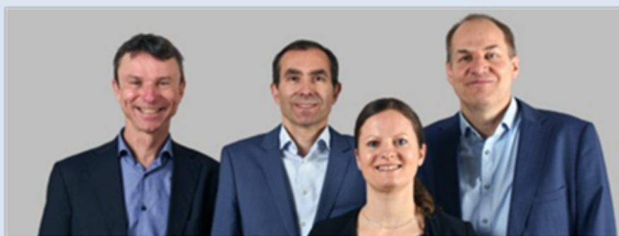
Collaborateurs du secrétariat du PCN (cf. www.seco.admin.ch/hkp )

Pour chaque demande d'examen, le secrétariat du PCN met en place un groupe ad hoc composé de représentants de différents services fédéraux pour s'assurer de l'expertise technique et de la connaissance du terrain nécessaires. Dans le cadre d'un examen préliminaire ( initial assessment ), le groupe de travail ad hoc examine les faits relatifs au cas (teneur matérielle de la requête, motivation, pertinence, compétence) et aux parties impliquées (identité, intérêt en tant que partie requérante) et décide par consensus s'il existe un lien avec les Principes directeurs et s'il est opportun que le PCN entre en matière. Dans l'affirmative, le PCN propose aux parties une procédure confidentielle de médiation. Les résultats de l'examen préliminaire et ceux de l'éventuelle procédure de médiation sont, eux, publiés. Le PCN peut par ailleurs formuler des recommandations aux parties dans son rapport final ( final statement ) et prévoir des activités de suivi spécifiques ( follow-up ).