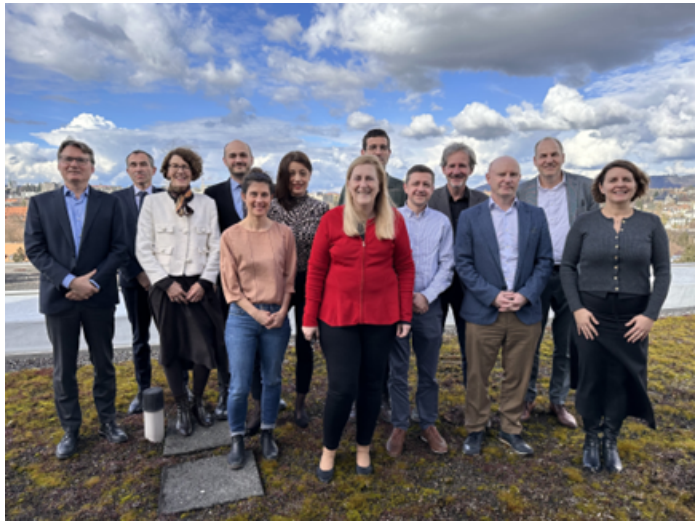
Membres de la commission consultative du PCN (cf. liste en annexe) et secrétariat du PCN