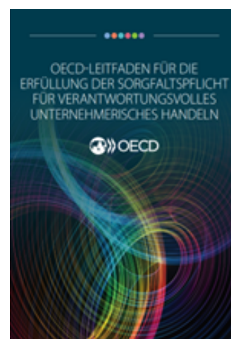
Guide OCDE sur le devoir de diligence pour une conduite responsable des entreprises