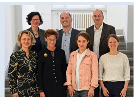
Rencontre entre les PCN d'Allemagne, d'Autriche et de Suisse (D-A-CH) à Berlin.