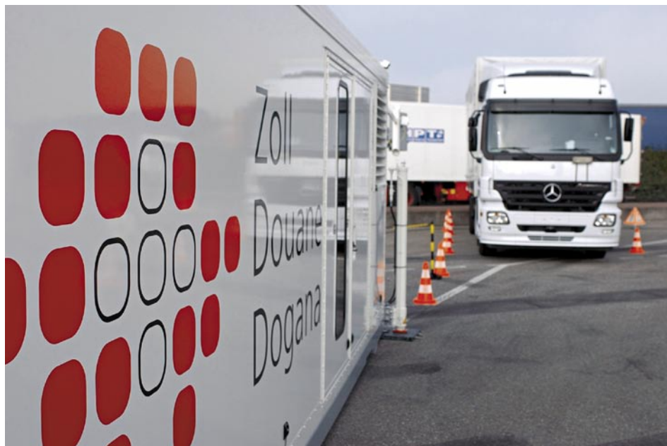
Jede grenzüberschreitende Transaktion muss dem Zollamt gemeldet werden. Die Zollabfertigungskosten fallen selbst bei den rund 80% der Importe an, für die kein Zoll bezahlt werden muss.

Die Zollschranken an der Schweizer Grenze verursachen hohe Kosten für Unternehmen und verteuern die Ex- und Importe. Erstmals konnten mit Hilfe einer breit angelegten Unternehmensbefragung in der Schweiz die Kosten der Grenze in Erfahrung gebracht werden. Die im Auftrag von Avenir Suisse durchgeführte Studie zeigt, dass die Zollschranken bei jährlichen Einnahmen von 1 Mrd. Franken für den Staat Belastungen von rund 4 Mrd. Franken für die Unternehmen verursachen. Das Bruttoinlandprodukt (BIP) der Schweiz reduziert sich dadurch um 0,85%. 1