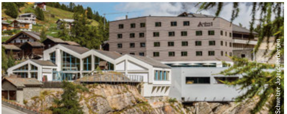
So sieht Innovation im Tourismus aus: die 2014 eröffnete Jugendherberge in Saas-Fee mit 168 Betten, Wellness-Bereich, Fitness-Raum und Hallenbad.

Doch die Zweitwohnungsinitiative ist für den Schweizer Tourismus auch eine Chance. Sie motiviert die Branche, inno- vative und nachhaltige Wachstums- und Finanzierungsmodelle zu finden, die weit- gehend ohne Quersubvention durch Zweitwohnungen auskommen. Um diese Chance zu nutzen, muss sich der Schweizer Tourismus an die neuen Rahmenbedin- gungen anpassen. Dies ist umso mehr eine Herausforderung, als es in Bezug auf die neuen Wachstums- und Finanzierungs- modelle offene Fragen gibt. Die Anpassung muss zudem in einem wegen der Franken- stärke schwierigen Umfeld erfolgen. ▶▶