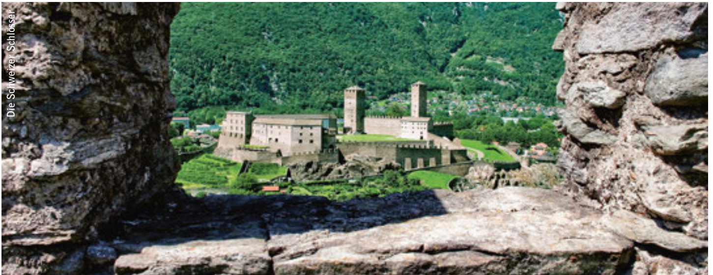
Castelgrande, eine der drei Burgen von Bellinzona, Teil des UNESCO-Weltkulturerbes.