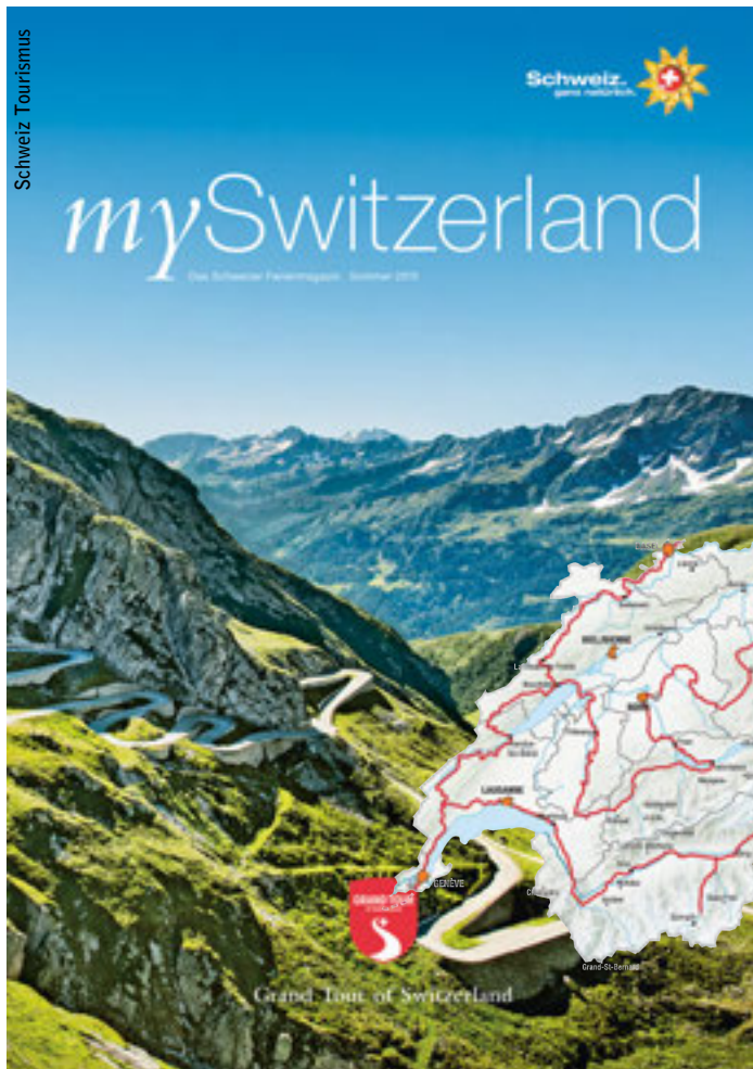
Beispiel eines hochstehenden touristischen Produkts: Die neue Grand Tour of Switzerland führt zu 44 Attraktionen, 22 Seen und über 5 Alpenpässe.

► Das bindet Kapazitäten, welche andernorts, beispielsweise bei der Entwicklung innovativer und qualitativ hochwertiger Produkte, fehlen.