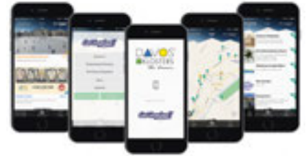
Die 2015 lancierte App Get inspired! von Davos und Klosters macht Vorschläge für Abenteuer, Entspannung und Vergnügen.

Wie können Bündner Tourismusorte im schwierigen Wettbewerbsumfeld bestehen? Das Wirtschaftsforum Graubünden hat drei Grundstrategien entwickelt. Sie können auch anderen Tourismusregionen Anstöße geben.