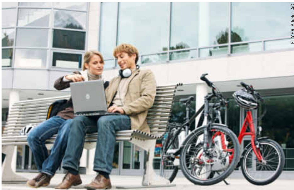
FLYER Biketeq AG