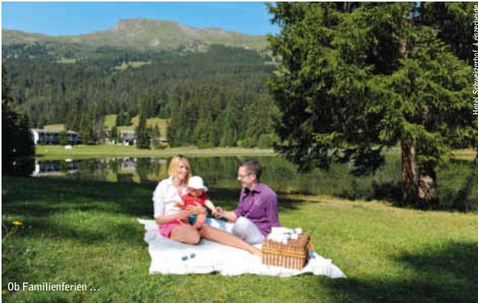
Ob Familienferien ...