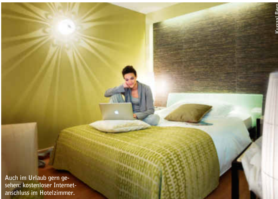
Auch im Urlaub gern gesehen: kostenloser Internetanschluss im Hotelzimmer.

6 | Online-Projekte ePlattform Graubünden, SwissVideoLibrary