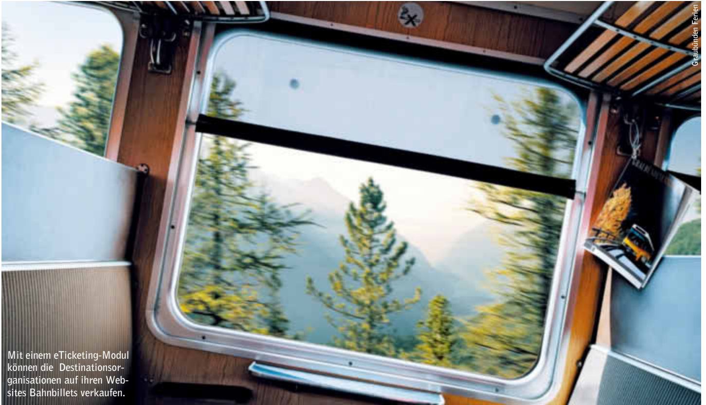
Mit einem eTicketing-Modul können die Destinationsorganisationen auf ihren Websites Bahnбилlets verkaufen.

Mit der ePlattform Graubünden wollen die Tourismusverantwortlichen des Kantons die internationale Wettbewerbsfähigkeit nachhaltig stärken. ePlattform Graubünden stellt für die touristischen Leistungserbringer wie Hotels, Ferienwohnungsvermieter oder Bergbahnen die Verbindung zu den wichtigsten internationalen Distributionskanälen sicher – zum Beispiel zu TUI in Deutschland oder zu den Hotelportalen booking.com und expedia.com.