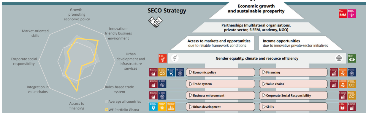
SECO/WE Strategy and business lines

On the left: The relative importance of the eight business lines in SECO/WE’s cooperation programme for Ghana. On the right: SECO/WE’s overall strategy , with economic growth and sustainable prosperity as the overarching goal, and the target outcomes and business lines below.