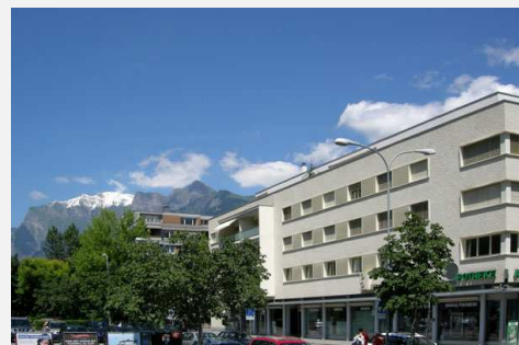
CSEM Landquart Building

csem centre suisse d'électronique et de microtechnique