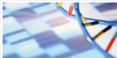
Sciences de la vie