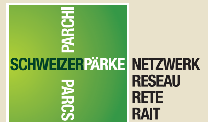
Réseau des parcs suisses 01/2014