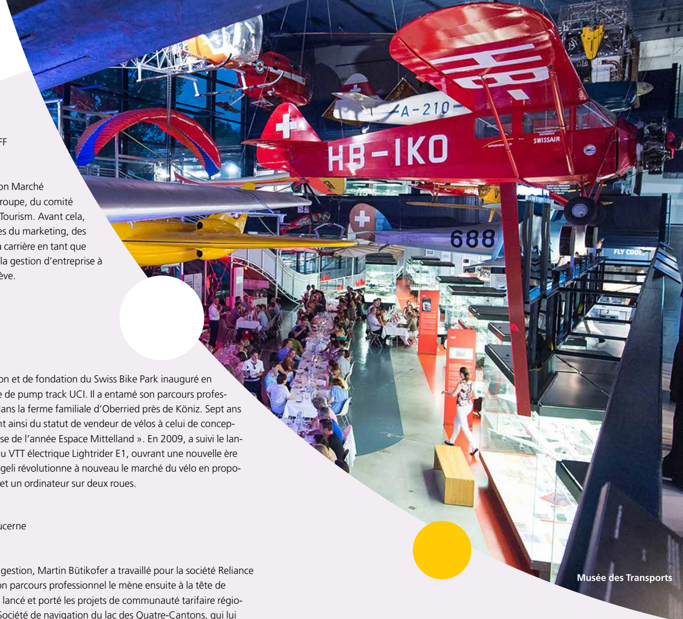
Musée des Transports