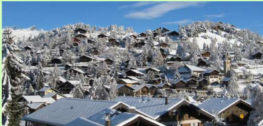
Vercorin (VS)