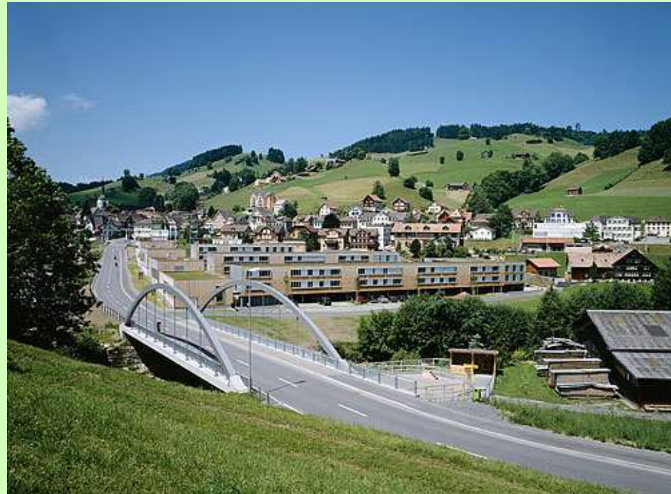
Village de vacances d'Urnäsch AR