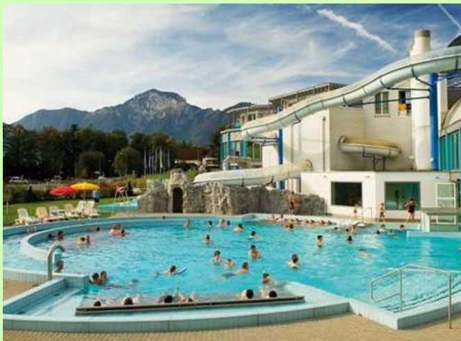
Swiss Holiday Park, Morschach