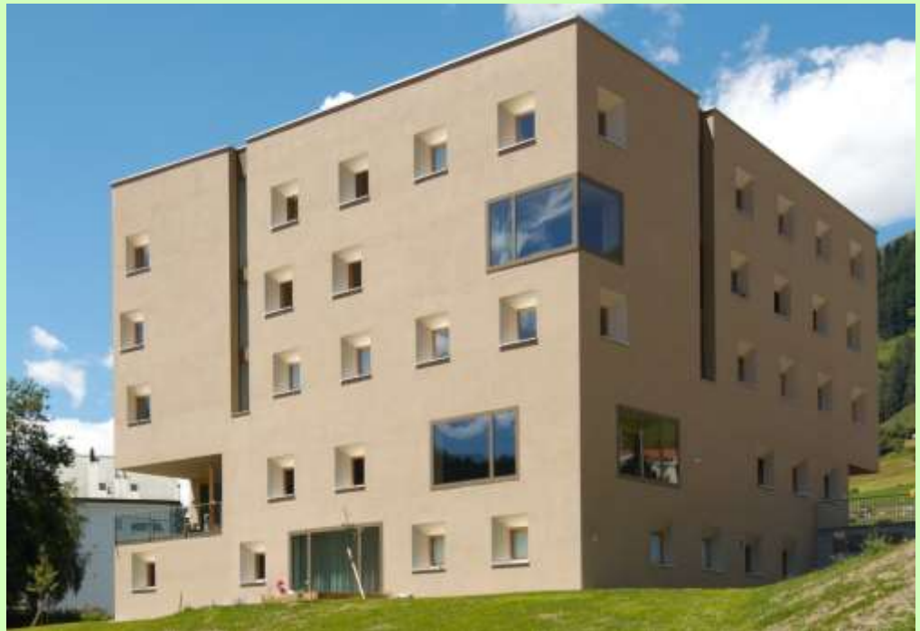
Auberge de jeunesse de Scuol

Prendre en compte les principes du développement durable permet de mieux relever à long terme les défis posés par la mutation structurelle.