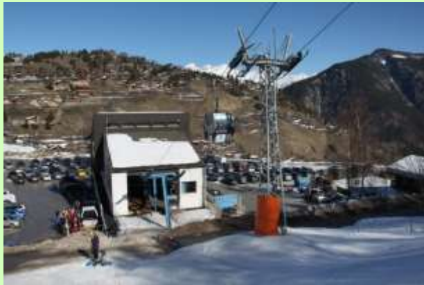
Vercorin-Siegeroulaz (VS)