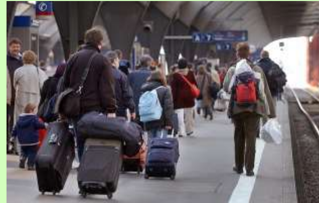
Zürich Hauptbahnhof