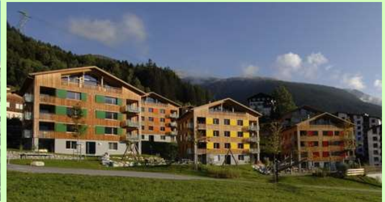
Village de vacances Disentis