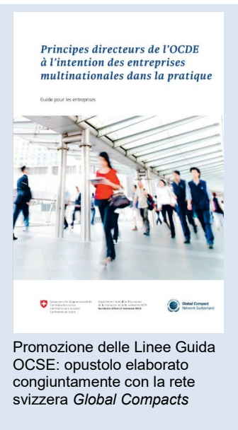
Promozione delle Linee Guida OCSE: opuscolo elaborato congiuntamente con la rete svizzera Global Compacts

Per raggiungere con le proprie risorse limitate un pubblico il più vasto possibile, il PCN ha fatto ricorso a reti e piattaforme esistenti. Mediante un partenariato istituzionalizzato con la Global Compact Network Switzerland gli strumenti dell'OCSE sono stati incorporati nelle attività promozionali di tale organizzazione. I meccanismi di dovuta diligenza dell'OCSE sono stati discussi anche ad altri eventi organizzati dall'Amministrazione federale per far conoscere i Principi guida dell'ONU su imprese e diritti umani. Da febbraio 2020 il PCN svizzero è anche presente su LinkedIn (in tedesco) 3 , dove ha conquistato oltre 500 follower entro la fine dell'anno in esame.