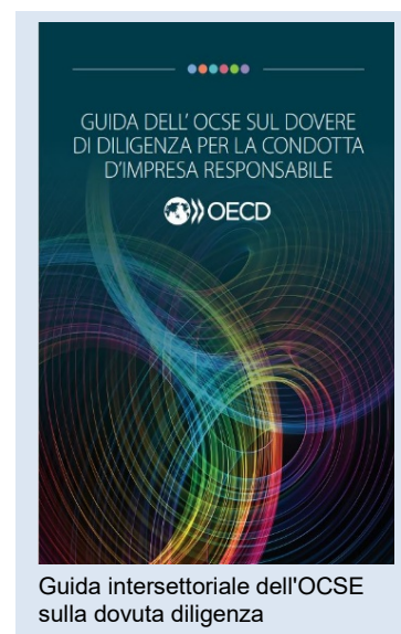
Guida intersettoriale dell'OCSE sulla dovuta diligenza