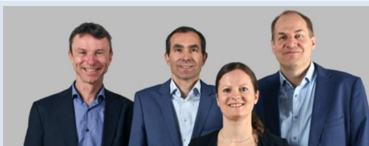
Collaboratori del segretariato del PCN (cfr. www.seco.admin.ch/nkp )

I 49 Stati firmatari promuovono l'attuazione delle Linee Guida OCSE in particolare attraverso i Punti di contatto nazionali (PCN). Questi PCN provvedono ad aumentare la visibilità delle Linee Guida. È a loro che possono essere segnalate le presunte violazioni. I PCN sono concepiti come piattaforma di dialogo e come organo di arbitrato extragiudiziale per domande e istanze. In Svizzera l'organizzazione e le competenze del PCN sono fissate in un'ordinanza del Consiglio federale 2 .