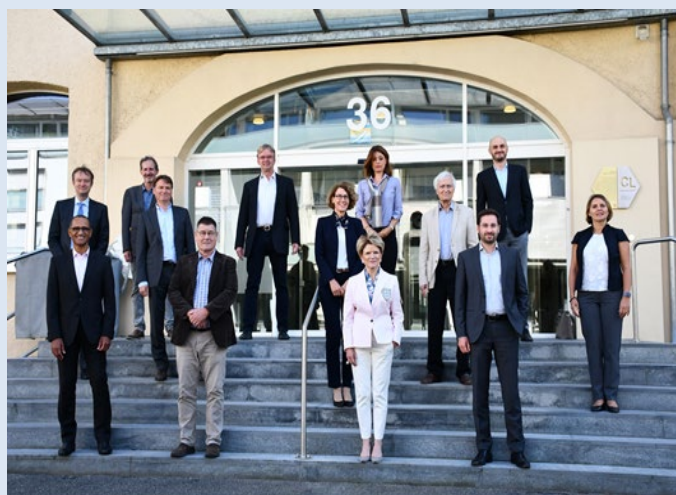
Commissione consultiva PCN il 15/9/2020 con quattro nuovi membri, v. www.seco.admin.ch/nkp > Commissione consultiva PCN

La Commissione consultiva presta consulenza al PCN sull'orientamento strategico, sull'applicazione delle Linee Guida OCSE e su aspetti procedurali. La Commissione è composta di 14 membri: il direttore della SECO e altri tre membri facenti parte dell'Amministrazione federale, due rappresentanti, rispettivamente, delle associazioni dei datori di lavoro, dei sindacati, delle associazioni economiche, delle organizzazioni non governative e del mondo scientifico. Nel 2020 le sue consulenze hanno riguardato soprattutto l'impatto sul PCN dell'iniziativa per imprese responsabili e della controproposta indiretta, la strategia e i processi del PCN nonché questioni riguardanti le popolazioni indigene.