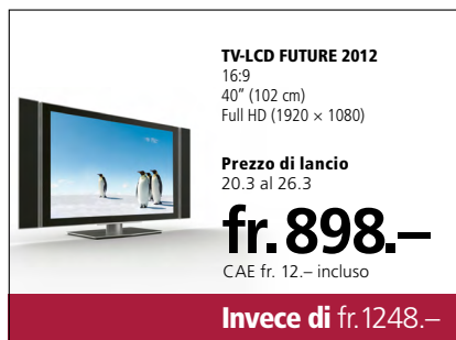
Illustrazione dell'esempio di prezzo di lancio di cui sopra

Il negozio Hi-Fi intende far conoscere alla clientela il televisore TV-LCD Future 2012, che ora fa parte dell'assortimento. A tale scopo Hi-Fi offre, per un breve periodo, il prodotto a un prezzo più conveniente. Dal 20 marzo, per una settimana, i prezzi nel negozio sono indicati come segue: «Prezzo di lancio fr. 898.– invece di fr. 1248.–». Contemporaneamente viene pubblicata la seguente inserzione →