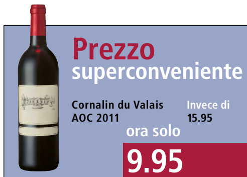
Illustrazione dell'esempio di autocomparazione di cui sopra (variante 1)

Il negozio Hell ha venduto, dal 3 aprile al 28 maggio, ossia per un periodo di 8 settimane, la bottiglia di 75 cl di vino rosso vallesano Cornalin 2011 al prezzo di fr. 15.95. Dal 29 maggio, la ditta ha ridotto il prezzo di questa bottiglia di vino a fr. 9.95. Per quattro settimane, ossia dal 29 maggio al 25 giugno, l'indicazione del prezzo nel negozio è la seguente: «invece di fr. 15.95 soltanto fr. 9.95». Contemporaneamente viene pubblicata la seguente inserzione →