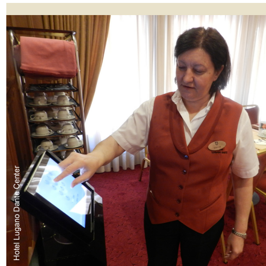
Hotel Lugano Dante Center